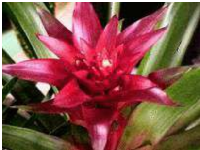
hoa móng rồng - bromeliads

“Xin lỗi, nhưng em sẽ không thực hiện được mong muốn ấy. Em bị kẹt với anh, em yêu, bởi vì đứa bé trong bụng em là của anh.”