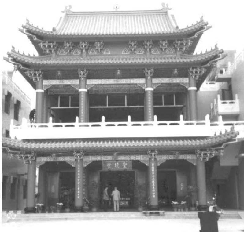
Thánh Hiền Đường ở Đài Trung thuộc Đài Loan