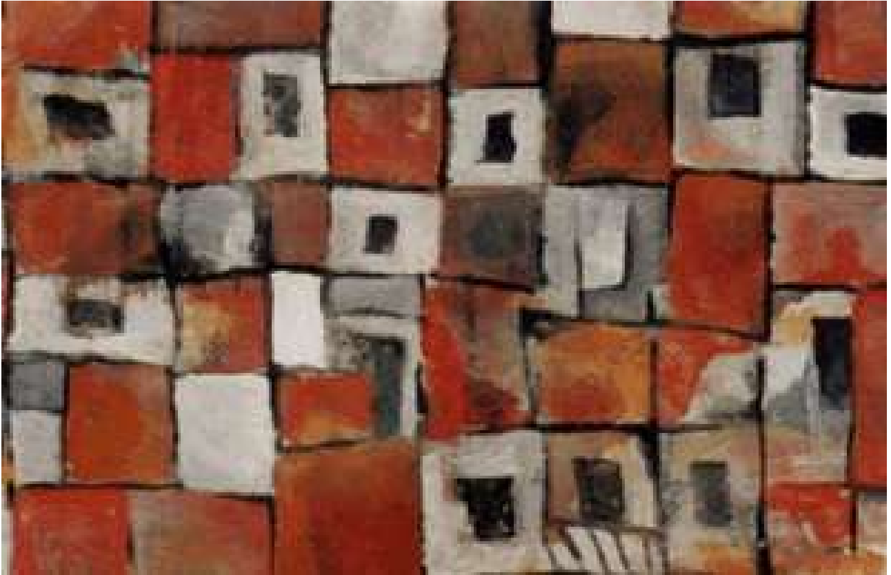
Tranh Phái về lại phố

Vẫn số nhà 87 như xưa, trên tường nhà treo đầy tranh Phái. Những bức ký họa chân dung bạn bè, người thân, những bức tranh chèo... và nhiều nhất vẫn là tranh phố cổ. Người đồng nghiệp đi cùng ngâm ngùi: "Nghĩ cũng lạ, mình là người Hà Nội hẳn hoi. Ngày nào cũng đi qua những dãy nhà này, phố này, vậy mà nhìn tranh phố Phái vẫn thấy có nét gì thật là đặc biệt".